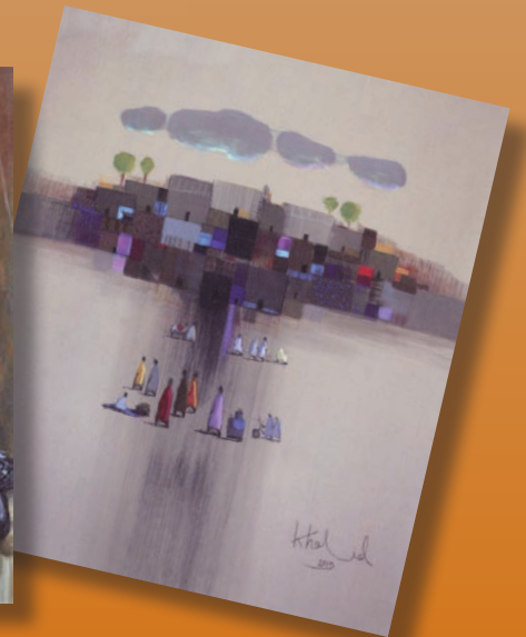
خالد الشطي.. القرية أكريليك مع كانفس