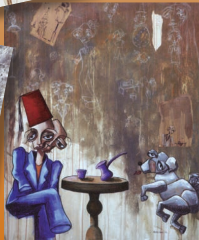
مريم الفصيل - ميكس ميديا